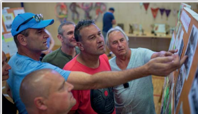
Živá diskuze na výstavě

hrad, kolotoč a možnost zacvičit si v hale. Oslavu zpestřili svým vystoupením Lanštorfčané a tanečníci ze studia NCOD. Bujará zábava trvala až do brzkých ranních hodin se skupinou Apollo. Dle reakcí zúčastněných se akce velmi vyvedla.