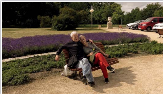
zmožení vůni levandule