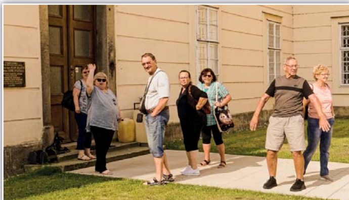
Nechtěl nás pustit dovnitř zámku