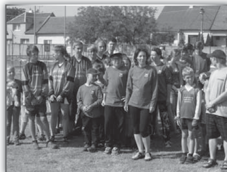
Fotografie z prvních dětských hasičských závodů v Ladané