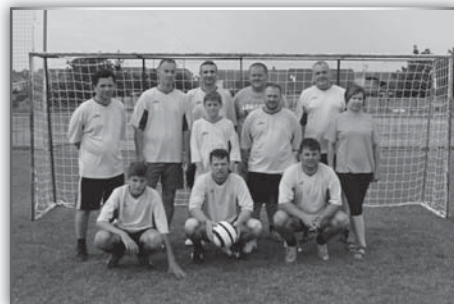
Sportovní s Lužní a Anenskou