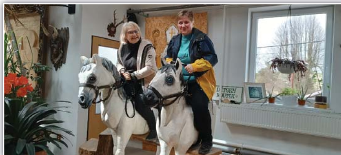
I dospělí mají rádi kolotoče, tak si to užili