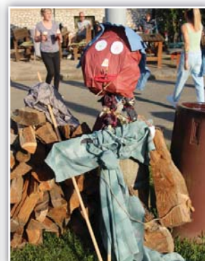
letošní čarodějnice Boženka