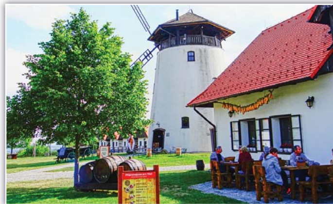
a odpočinek na Bukovanském mlýně