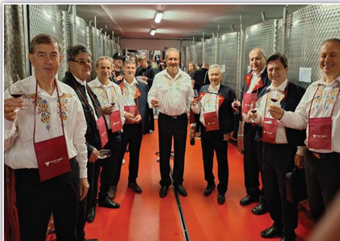
Zaječské otevřené sklepy