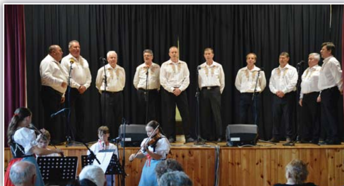
Jarní zpívání v Lanžhotě