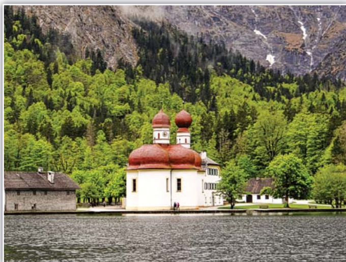
Kostelík sv. Bartoloměje