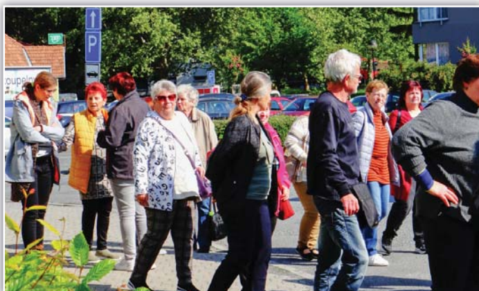
Hurá na oběd