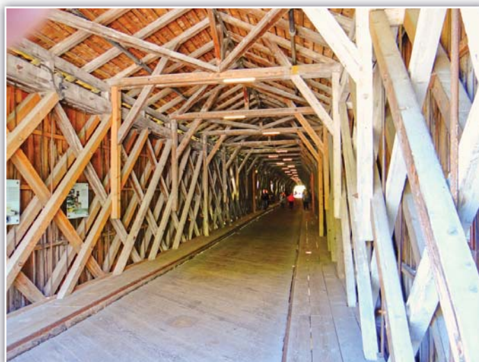
Uvnitř dřevěného mostu