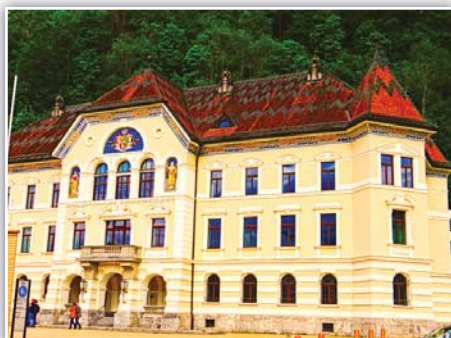
Budova zemského sněmu