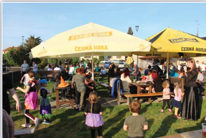
Letošní účast byla hojná