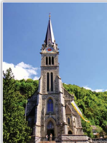
Kostel sv. Floriána