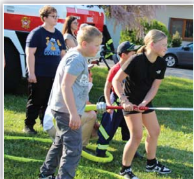
Snaha uhasit hořící domeček