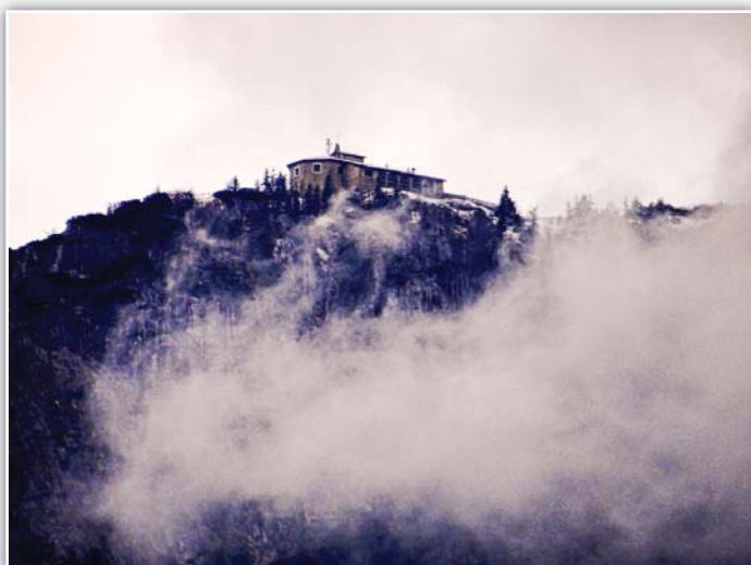
Hitlerovo Orlí hnízdo