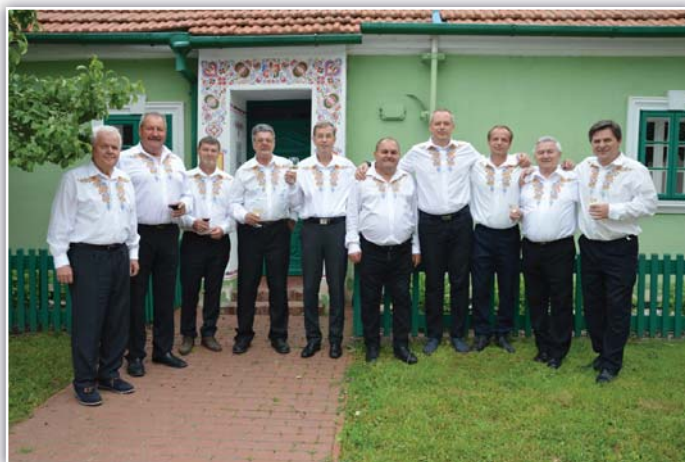
Jarní zpívání v Lanžhotě