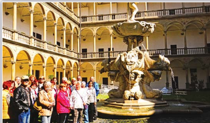
výletníci u Bakchovy fontány