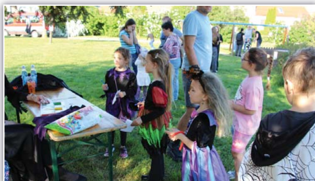
Děti soutěží na stanovištích

Jakmile děti ukončily soutěže, upálily připravenou čarodějnici a mohlo začít opékání špekáčků. Všechny masky obdržely sladkosti, bublifuk a nálepky nebo tetovačky. Večer potom zábava pokračovala s country skupinou Čtyřlístek, a to až do pozdních hodin po půlnoci. Poděkování patří všem, kteří se na akci podíleli a přispěli tak k jejímu zdaru.