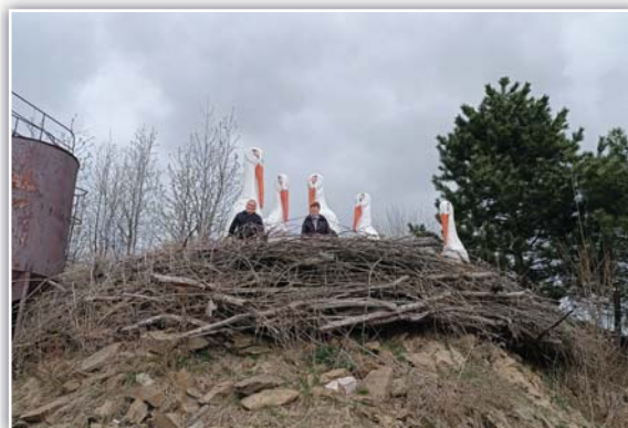
Čapí hnízdo a můj s mojí