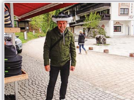
Hádejte, který kovboj se k nám přidal?