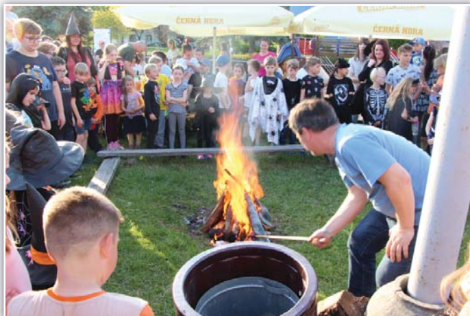
A už je upálená