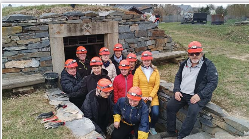
Odvážní před sestupem do stříbrného dolu