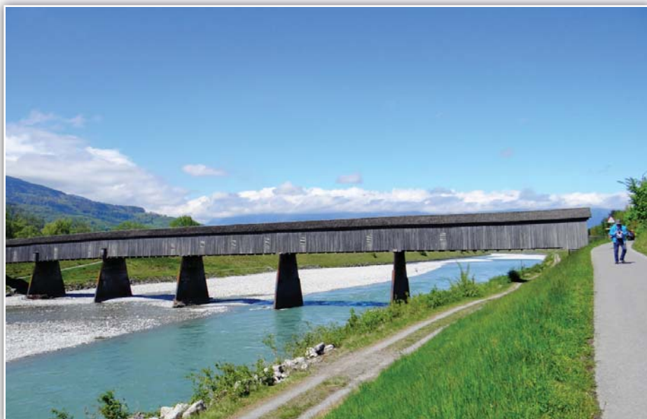
Most přes Rýn