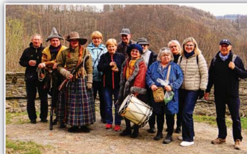
Výletníci s vystupujícími