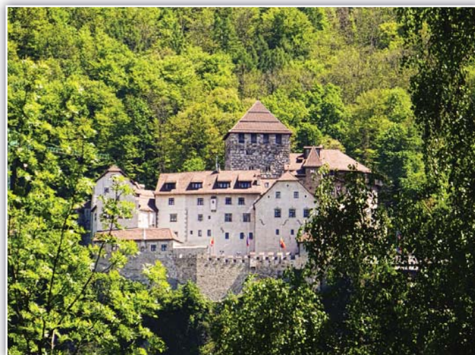
Knížecí lichtenštejnský hrad a zámek