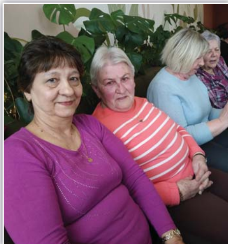
Nejlíp je v cukrárně