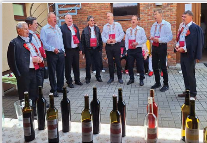
Zaječské otevřené sklepy