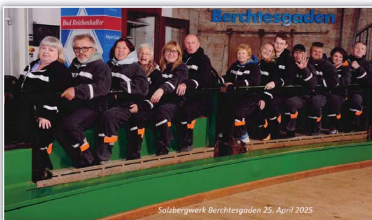
U vjezdu do dolu

Druhý den po snídani jsme vyrazili k cíli naší cesty, což byl Vaduz. Počasí nám přálo, bylo přímo ukázkové, tak jsme si celé odpoledne užili. Jedinou nevýhodou bylo, že hrad není přístupný, protože rodina Lichtenštejnů na hradě bydlí. Ale výhledy od něj byly nádherné. Prošli jsme se po dřevěném mostu přes řeku Rýn. Uprostřed řeky i mostu vede hranice se Švýcarskem. Při prohlídce města jsme viděli kostel sv. Floriána, budovu zemského sněmu, radnici, Národní muzeum, klenotnici, poštovní muzeum a další. Po šesté hodině večerní jsme se vydali zpět k domovu. Všichni účastníci byli spokojeni a už se prý těší na příští rok kdy bychom chtěli navštívit Srbsko a jeho hlavní město Sarajevo. Přidejte se k nám.