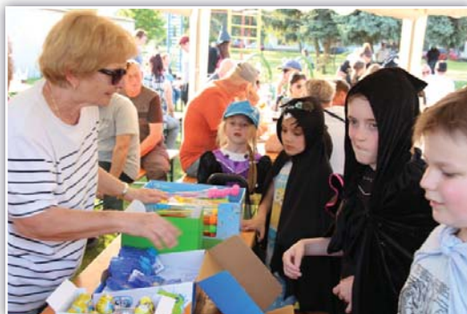
Odměna za masky