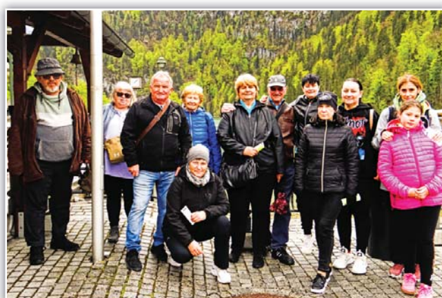
čekání na odjezd loďky