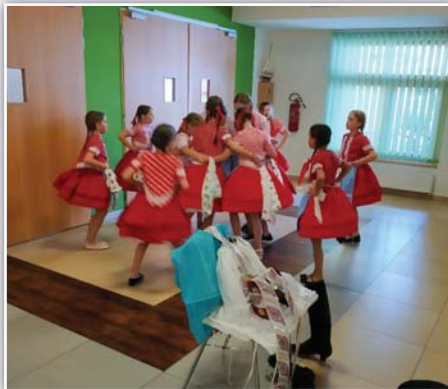
Vystoupení ke Dni matek