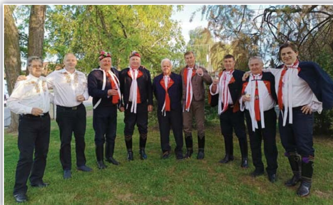
Setkání mužských sborů Regionu Podluží v Moravském Žižkově