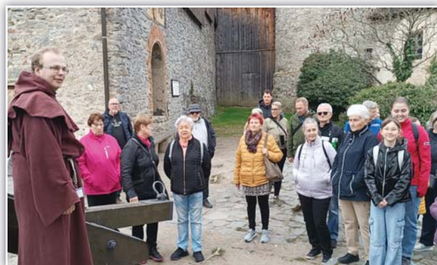
Průvodce s mniškou kutnou františkána