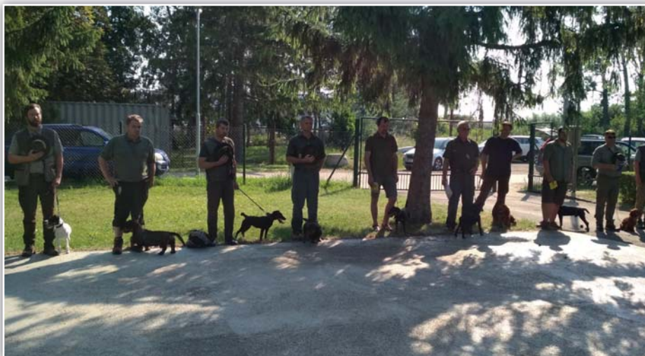
Zkoušky z norování v Podivíně