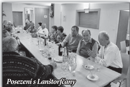
Posezení s Lanštorfčany