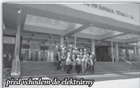
před vchodem do elektrárny