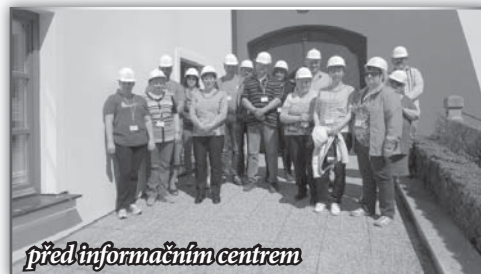
před informačním centrem