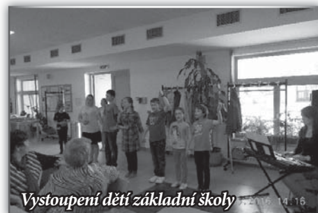
Vystoupení dětí základní školy