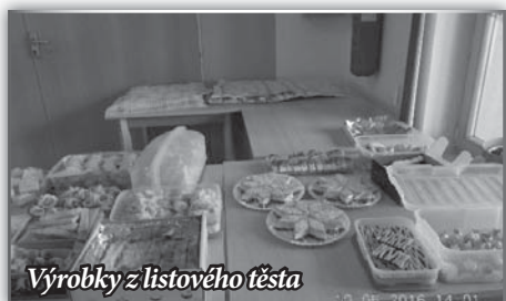
Výrobky z listového těsta