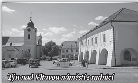
Týn nad Vltavou náměstí s radnicí