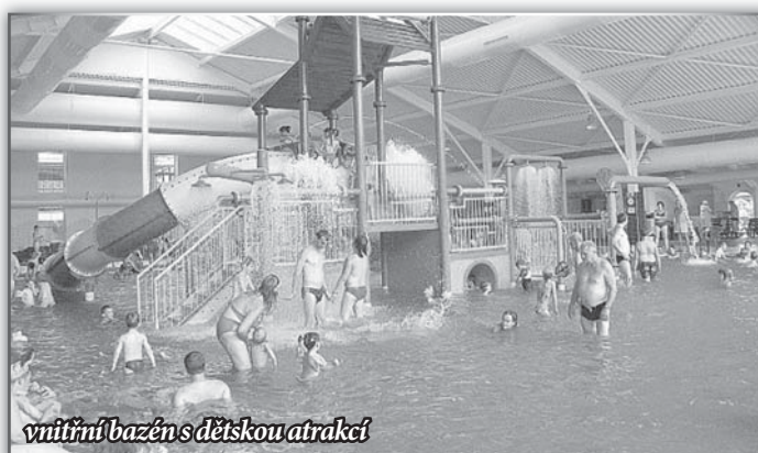
vnitřní bazén s dětskou atrakcí