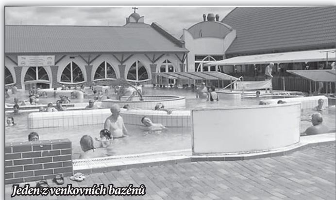
Jeden z venkovních bazénů

kovních a také obrovské venkovní tobogány, dětská hřiště, hřiště na plážový volejbal, lanové centrum, spousta občerstvovacích zařízení, masáže, sauna a další služby. Počasí nám přálo, takže si každý užil podle svých představ.