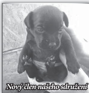
Nový člen našeho sdružení