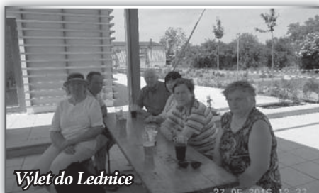
Výlet do Lednice