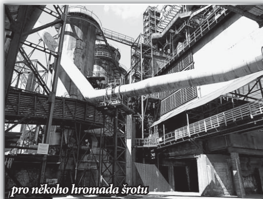
pro někoho hromada šrotu