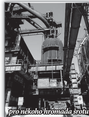
pro někoho hromada šrotu.