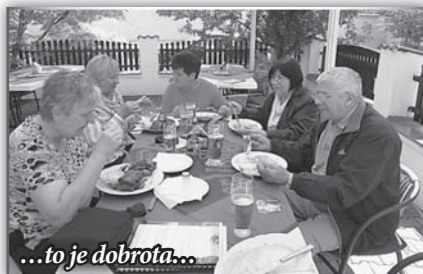
...to je dobrota...