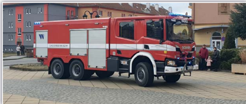
Zrealizované projekty, zdroj: archiv MAS

Kanceláře MAS: Masarykovo náměstí 115/27, 695 01 Hodonín info@jiznislovacko.cz www.jiznislovacko.cz Facebook @jiznislovacko