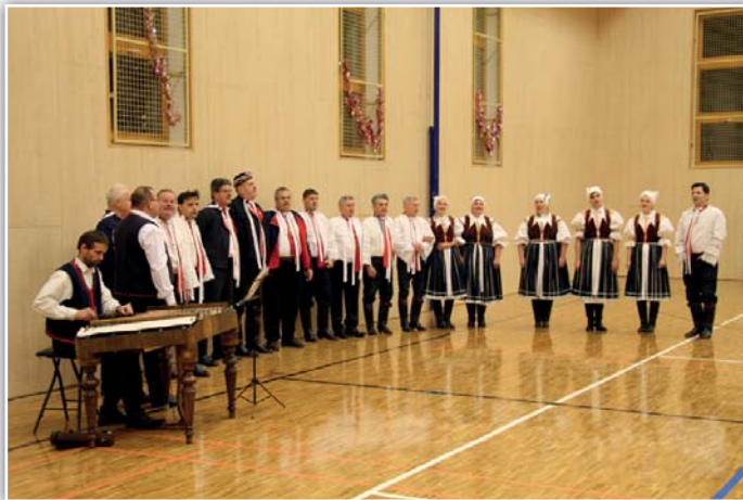
Společná závěrečná píseň