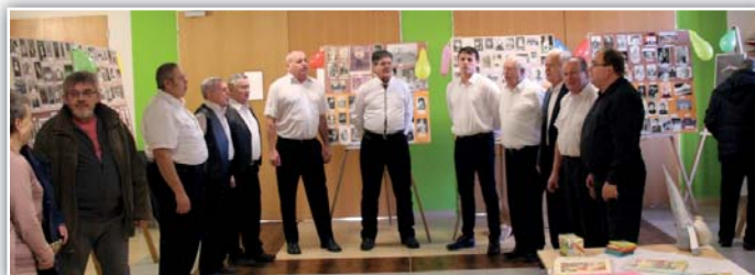
Výstava Klubu seniorů