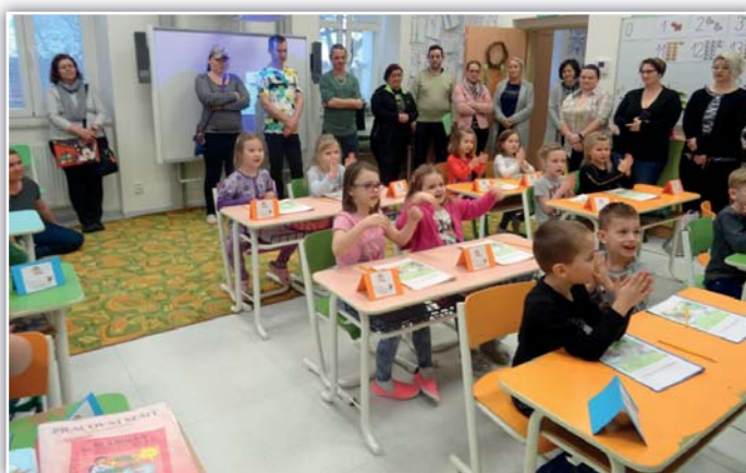
Edukačky v ZŠ