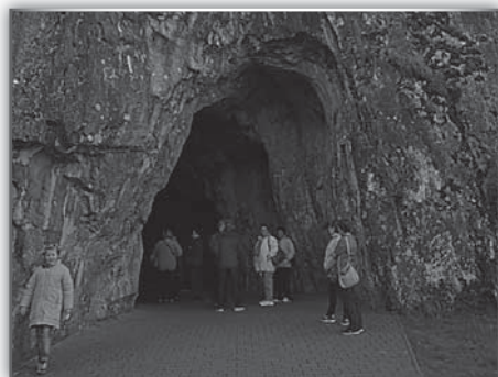
Vchod do jeskyně

zájemců vyšlapalo 192 schodů ve věži kostela, kde bydlel od svého narození skladatel Bohuslav Martinů. Navštívili jsme i místní hřbitov, kde má svůj hrob. Prý do pěti let neopustil místnost na vrcholu věže. Dále jsou v Poličce mohutné hradební zdi s 19-ti věžemi.