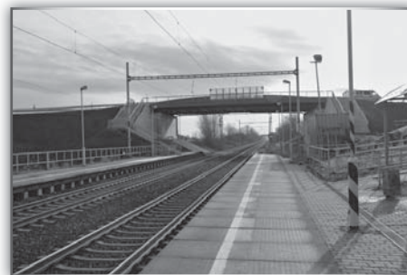
Který je hezčí?