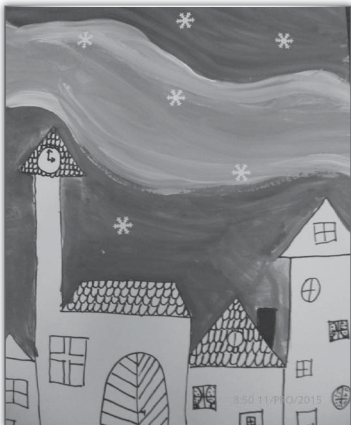
Zimní město (Saša Dobšáková, 5. ročník)