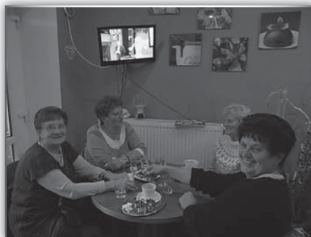
výletnice na kafičku