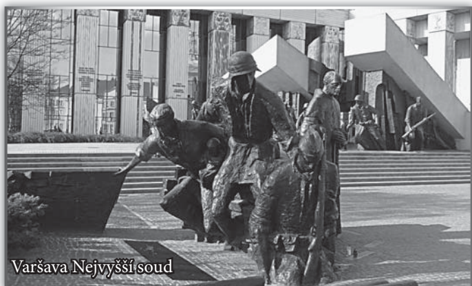
Varšava Nejvyšší soud