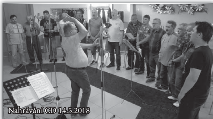
Nahrávání CD 14.5.2018