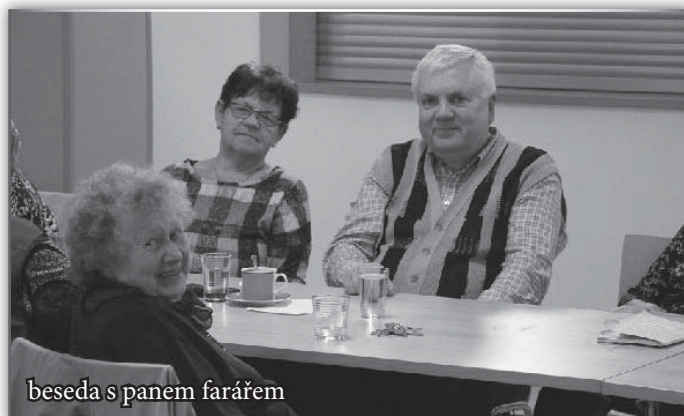
beseda s panem farářem