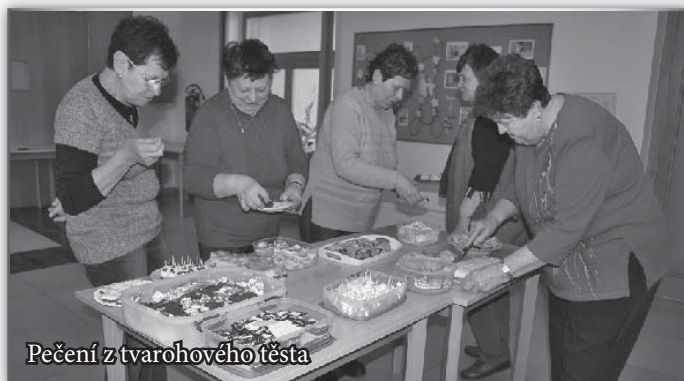
Pečení z tvarohového těsta