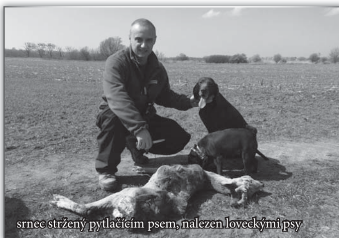
srnec stržený pytláčím psem, nalezen loveckými psy