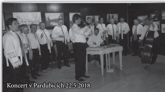
Koncert v Pardubicích 22.5.2018