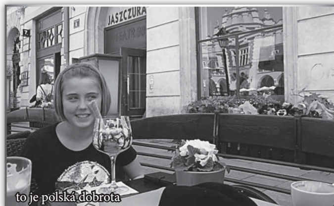
to je polská добрta