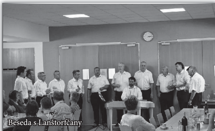
Beseda s Lanštorfčany