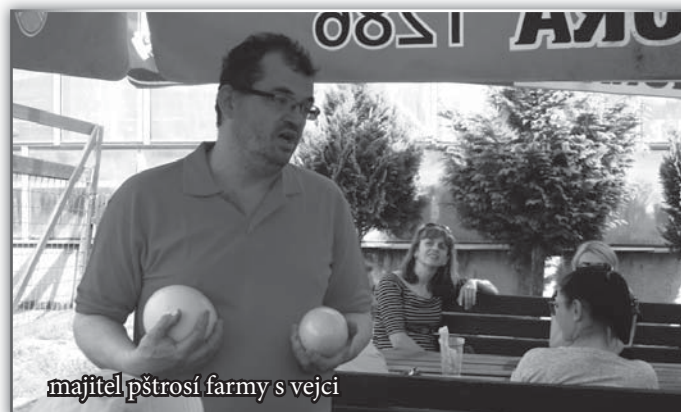
majitel pštrosí farmy s vejci